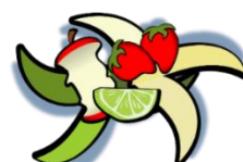
non abbandonare rifiuti