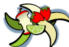
non abbandonare rifiuti